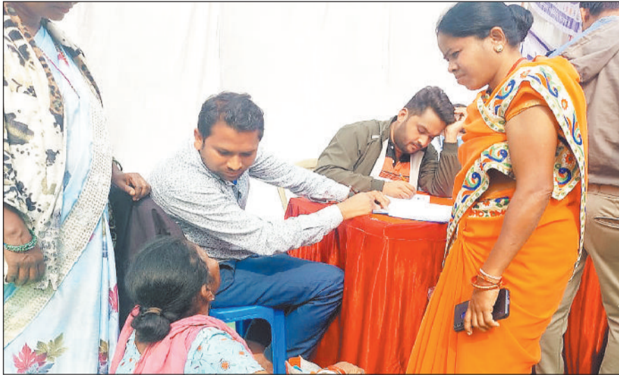
शिविर में हितग्राहियों को योजनाओं की जानकारी देते प्रशासनिक अधिकारी।

कैप में निगम के अंतर्गत स्वास्थ्य परीक्षण, टीबी स्क्रीनिंग बीपी शुगर की जांच कैप सहित निगम से संबंधित पीएम मोर जमीन