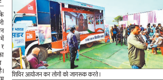
शिविर आयोजन कर लोगों को जागरूक करते।

विकसित भारत संकल्प यात्रा के माध्यम से जनकल्याणकारी योजनाओं की पहुंच अब जन-जन तक है। जिले के सभी विकासखंड में शि वि र आयोजन का सि ल सि ला जारी है। प्रतिदिन 10 ग्राम पंचायतों में शिविर आयोजित की जा रही है। जिसमें हर वर्ग के लोग बहुरूप कर हिस्सा ले रहे हैं। इसी कड़ी में आज मनोरा विकासखण्ड के ग्राम पंचायत पोड़ीपटकोना सहित अन्य विकासखंडों के ग्रामों में विकसित भारत संकल्प यात्रा प्रदर्शनी। जहां आयोजित शिविरों में वैन के माध्यम से लोगों को शासन की जनकल्याणकारी योजनाओं की जानकारी दी जा रही है। साथ ही शिविर आयोजित की जा रही है।