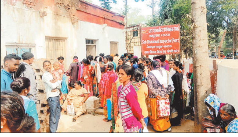
व्या कहेता है डाक विभाग: डाक विभाग में चर्चा करने पर उन्होंने बताया हमारे विभाग द्वारा किसी भी प्रकार से महिलाओं को खाता खोलने के लिए प्रोत्साहित नहीं किया गया है और न ही किसी भी तरह का योजना चलाई गई है। हमने अपने दरफ से समाह्वया है कि सरकार ने किसी भी योजना की हमको जानकारी नहीं दी है। फिर भी अगर कोई हमारे डाकघर में खाता खोलना चाहता है तो हम स्वागत और सहयोग करेंगे। हमने नोटिस चरपा कर दिया है।

छत्तीसगढ़ विधानसभा चुनाव के दौरान भारतीय जनता पार्टी ने मध्य प्रदेश लाडली बहना योजना के तर्ज पर महतारी वंदन योजना शुरू करने की घोषणा की थी। इसके तहत छत्तीसगढ़ में निवासरत प्रत्येक शादीसुदा महिला को हर महीने एक हजार रुपए उनके खाते में दिए जायेंगे। यह रकम शासन द्वारा सीधे महिला के खाते डाला जाएगा। भाजपा की सरकार तो बन गई लेकिन अभी तक महतारी वंदन योजना को लेकर किसी भी प्रकार का आदेश नहीं है। लेकिन पिछले चार दिनों से जशपुर जिला मुख्यालय के डाकघर में महिलाओं की भारी भीड़ खाता खोलवाने के लिए डाकघर में लग रही है। डाकघर में खाता खुलवाने आई महिलाओं ने चर्चा में बताया है कि खाता खोलवाने के लिए डाकघर में लग रही है। डाकघर में खाता खुलवाने आए हैं। जिससे महतारी वंदन योजना में सरकार द्वारा दिया जाने वाला पैसा सीधे हमारे खाते में आ सके।